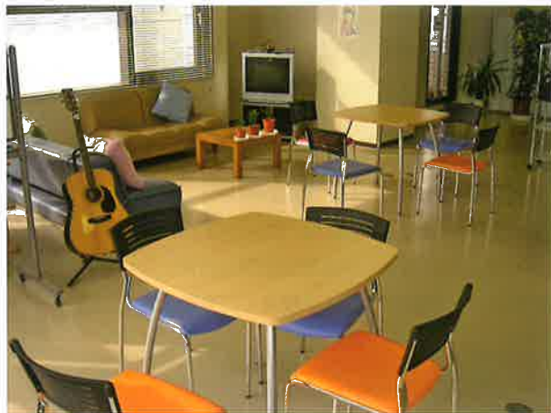
土浦サテライト内